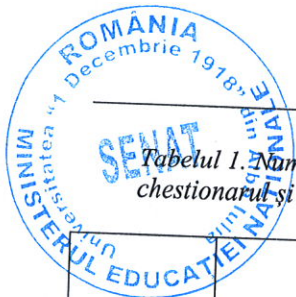
Tabelul 1. Numărul de absolvenți ai programului de studiu Marketing, promoțiile 2013-2017 care au completat chestionarul și au găsit un loc de muncă, respectiv care au găsit un loc de muncă în domeniul de studiu absolvit